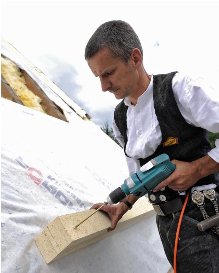
Traufbohle aus recyceltem PU-Hartschaum.

Nicht verunreinigtes PU-Hartschaum Material kann also sortenrein gesammelt und dem Recycling zugeführt werden.